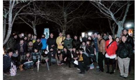
3月10日(土) 参加大学との講習会