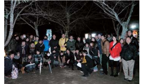
3月10日(土) 参加大学との講習会